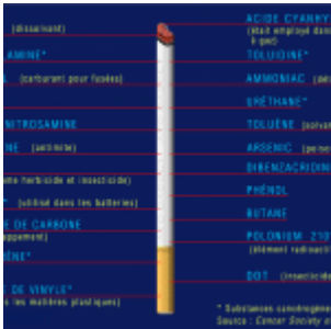
Flashback : La vérité sur la cigarette