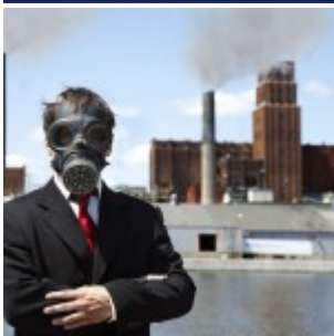
L'air trop pollué pour 95% des citadins européens