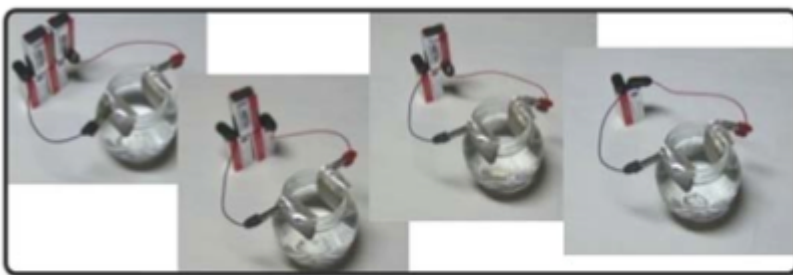
Diminution progressive du nombre de piles utilisées

jouera un rôle dans le processus. Tout ceci sans compter d'autres paramètres évidents tels que la distance entre les électrodes, la qualité de l'eau de départ, la surface d'argent accessible, etc. Pour ces raisons, il n'y a pas de « recette miracle » qui garanti une concentration particulière avec des paramètres donnés et fixes. Ne vous fiez pas trop à ce qu'on en dit sur le Net car plusieurs personnes donneront des indications précises en avançant que vous obtiendrez une concentration de X ppm. Ne prenez ces indications que comme un guide de départ car sans testeur de densité, l'opération se fait à l'aveuglette et chacun d'entre vous aura des résultats différents, et ce, sans même les connaître!