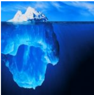
Et tout ceci n'est que la pointe de l'iceberg