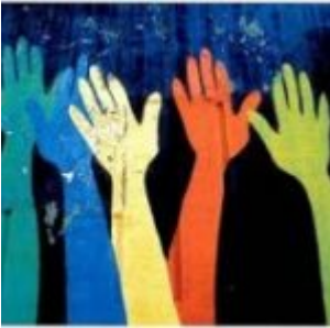
On ne change pas le monde avec seulement de l'indignation