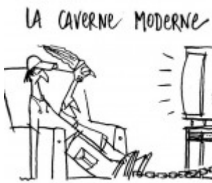
Allégorie de la Caverne de Platon et temps actuels