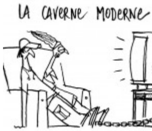
Allégorie de la Caverne de Platon et temps actuels