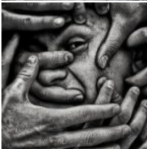
Despotisme et mépris des peuples