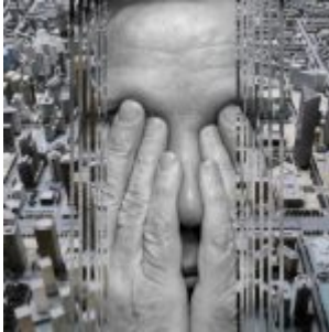
Lettre ouverte aux autres humains