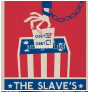
Voter, c'est se choisir un maître