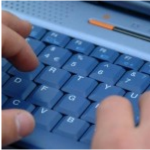
L'ordinateur réduit l'espérance de vie