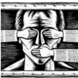
Les comploteurs des temps modernes