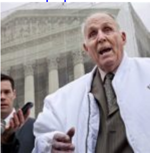
Brevets : la Cour suprême donne raison à Monsanto