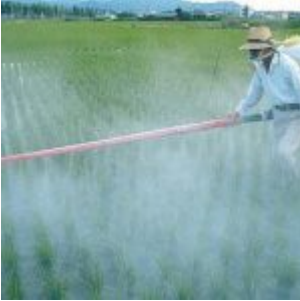
Le Roundup de Monsanto détruit les cellules rénales humaines