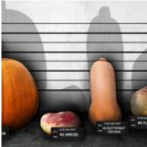
450 euros d'amende pour diffusion de « légumes clandestins »