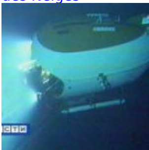
Flashback - l'Arctique convoité : Un drapeau russe sous le pôle Nord