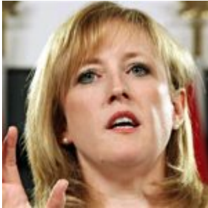
Canada : huez un ministre, soyez suspendu