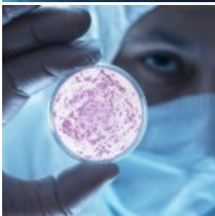
États-Unis : une bactérie mortelle échappée d'un laboratoire haute sécurité