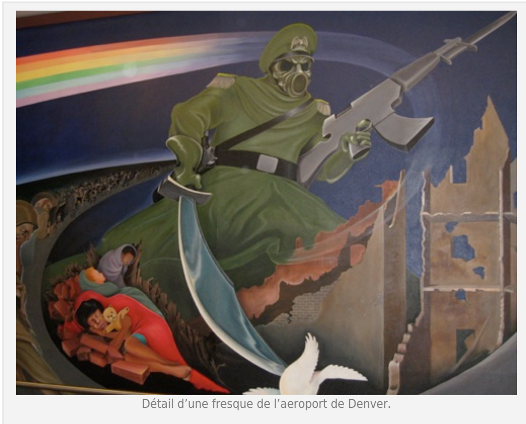
Détail d'une fresque de l'aéroport de Denver.

Infos de dernière minute : 2 grosses taches viennent d'apparaître à la surface du soleil, elles feront face à la Terre d'ici quelques jours.