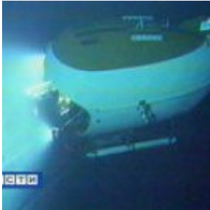
Flashback - l'Arctique convoité : Un drapeau russe sous le pôle Nord