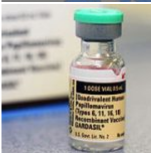
Conflits d'intérêts liés à la vaccination contre le VPH au Québec