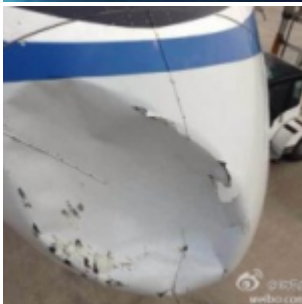
Un avion d'Air China percute un objet non-identifié à 8000 mètres d'altitude