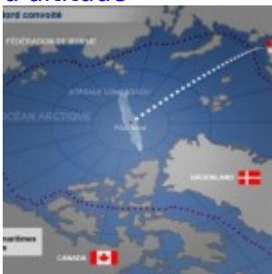
Flashback - Conquête de l'Arctique : Le Danemark dans la course