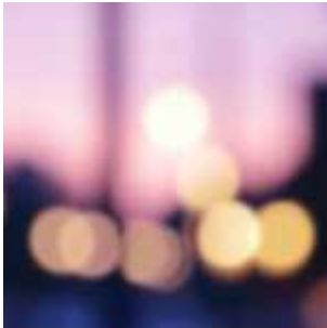
Dans le cerveau des méchants