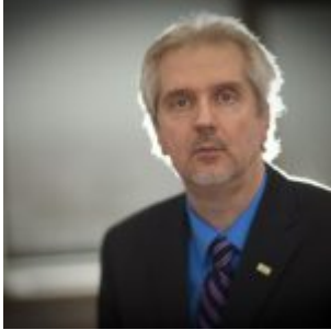
Mon collègue, ce psychopathe

Ces gens qui n'éprouvent ni sentiments ni émotions (ou presque) et que nous subissons sans savoir pourquoi