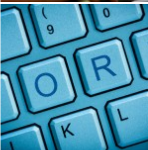
La pornographie fait rétrécir le cerveau