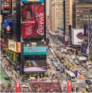
L'empreinte inconsciente des publicités