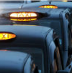
L'apprentissage a un impact physique sur le cerveau