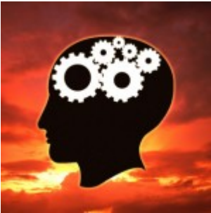
Les faux souvenirs ou comment on croit se rappeler ce qu'on n'a jamais vécu