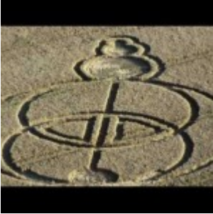
Nouvelle formation au Royaume-Uni