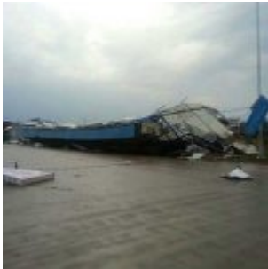
Chine et États-Unis : épisode de grêle, d'orages et de tornades