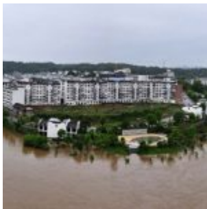
Planète inondations : Chine, Arabie Saoudite et France