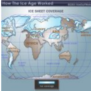
Des scientifiques annoncent 100 ans de refroidissement climatique