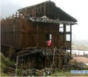
Chine : des averses de grêle font 3 morts et 25 blessés