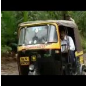
Pluie rouge en Inde