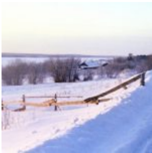
Chutes de neige rose dans le sud de la Russie