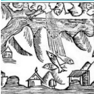
Le ciel nous tombe sur la tête... depuis toujours!