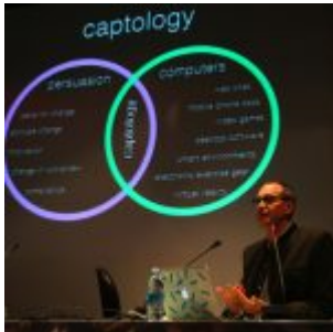
Flashback - Facebook utilise la « captologie » pour influencer ses moutons numériques

Facebook utilise la « captology » pour influencer ses moutons numériques