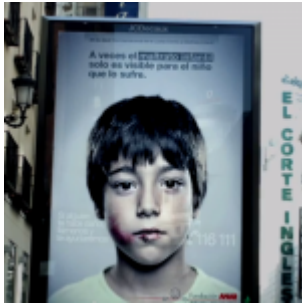
Un message secret dissimulé dans une affiche que seuls les enfants peuvent voir