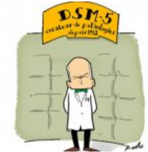
DSM : quand la psychiatrie fabrique des individus performants et dociles