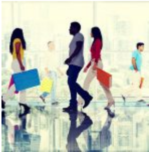
Noam Chomsky - Fabriquer des consommateurs