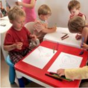
France : vers l'évaluation des élèves « à risque » dès 5 ans