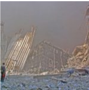
Quiconque s'intéresse aux irrégularités de la version officielle du 11 septembre est un complotiste