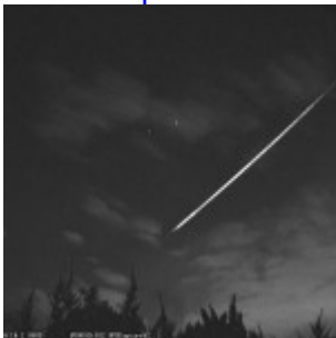
Planète météores : Russie, France(2), Brésil(3), Japon(3), Roumanie(2)