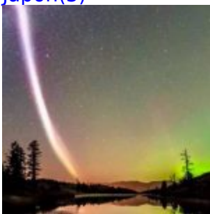
Un nouveau phénomène astronomique intrigue la communauté scientifique