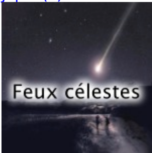
France : Une grosse boule de feu traverse le ciel