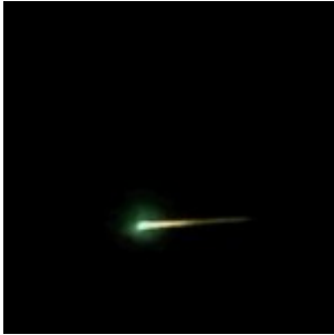
Des résidents du Québec témoignent avoir vu des « boules de feu » dans le ciel