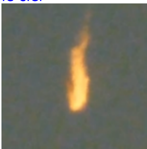
Planète météores : France(2), Canada, Finlande, Mexique, États-Unis(3), Japon(3)