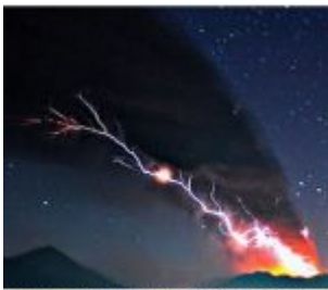
Fluide sort du cratère du mont Shinmoedake sur l'île de Kyushu, Japon.

Séismes et volcans : l'explication électrique