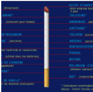
Flashback : La vérité sur la cigarette