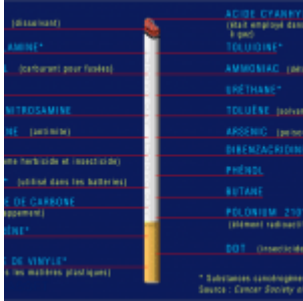
Flashback : La vérité sur la cigarette