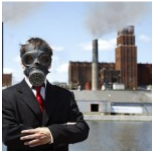
L'air trop pollué pour 95% des citadins européens