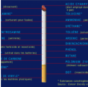
Flashback : La vérité sur la cigarette