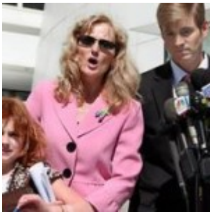
Les vaccins directement liés aux cas d'autisme : des juges indemnisent des familles