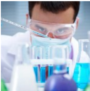
Ebola : le vaccin canadien testé sur des humains