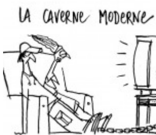
Allégorie de la Caverne de Platon et temps actuels