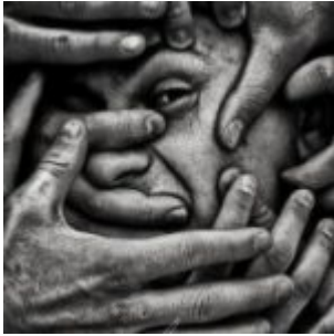
Despotisme et mépris des peuples