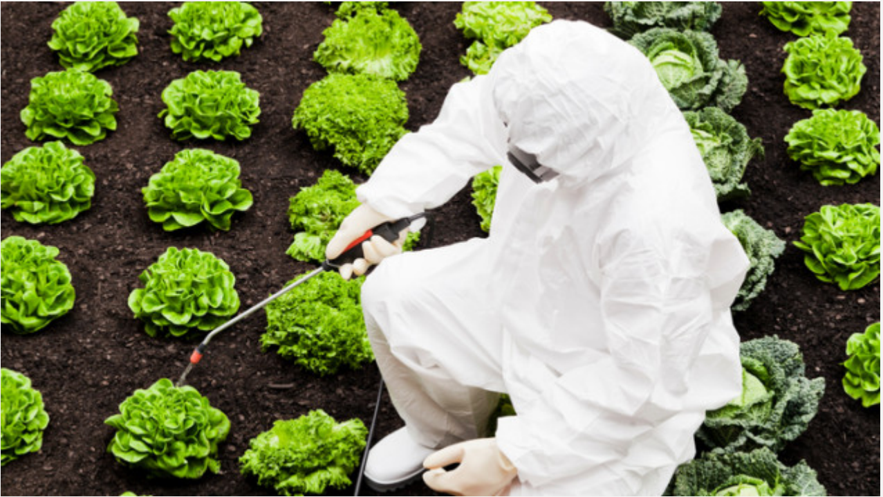
Traitement de légumes aux pesticides