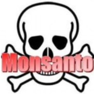
États-Unis : Monsanto attaqué en justice par 270 000 agriculteurs bio