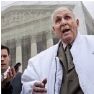
Brevets : la Cour suprême donne raison à Monsanto