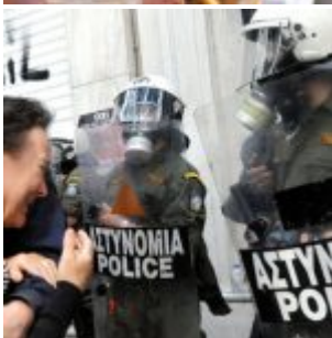
Fox N'importe quoi : des images de la Grèce dans un reportage sur les manifestations en Russie