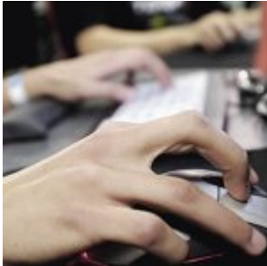
De fausses études scientifiques générées par un programme informatique