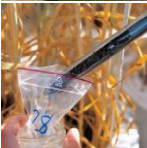
Un blé « bio » génétiquement modifié, ça existe malheureusement