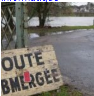
Que faire contre toutes ces inondations? Bah, créons une taxe!