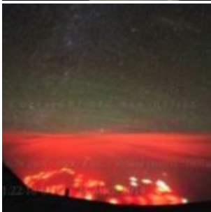
De mystérieuses lumières rouges observées par un pilote dans le Pacifique