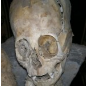
Une mystérieuse momie péruvienne à l'aspect étrange