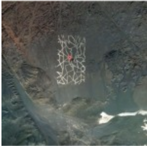
Google maps : d'étranges structures géantes repérées dans le désert chinois