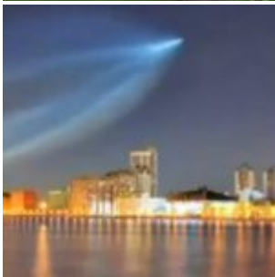
Que s'est-il passé en Oural le 4 Mai 2011?