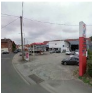
France : des phénomènes inexplicables troublent une station-service à Pas-de-Calais