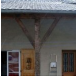
Lozère : une maison «hantée» sème le trouble dans un village