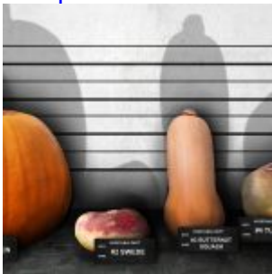
450 euros d'amende pour diffusion de « légumes clandestins »