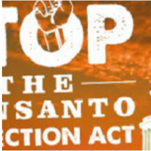
États-Unis : Le sénat donne à Monsanto plus de pouvoir que le gouvernement