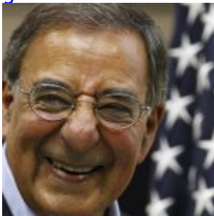
En attrapant Ben Laden, le secrétaire américain à la Défense a gagné son pari : du vin de 1870