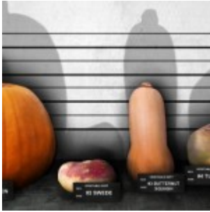
Flashback - 450 euros d'amende pour diffusion de « légumes clandestins »