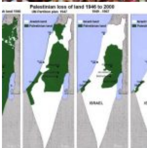
Psychopathie en action : Israël a le droit de se défendre!