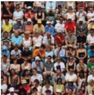
Le cerveau des psychopathes est différent