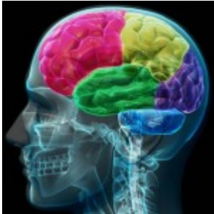
Flashback - Psychopathes : au-delà de la folie