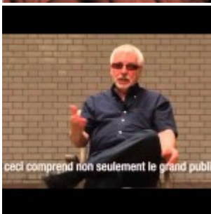
Rencontre avec Robert HARE, spécialiste mondial de la psychopathie