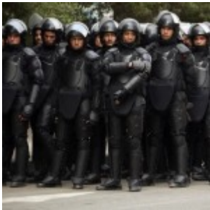
En attendant le débarquement