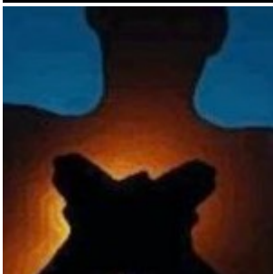
La vie existe en théorie