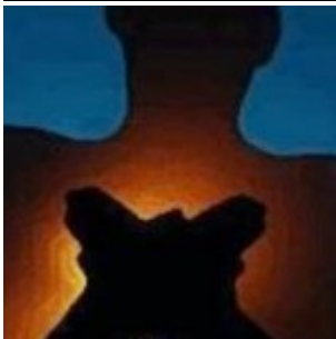
La vie existe en théorie