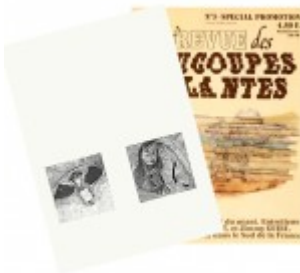
La Revue des Soucoupes Volantes