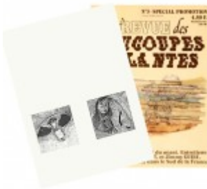
La Revue des Soucoupes Volantes