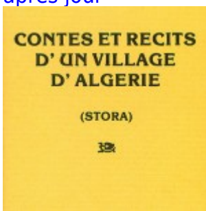
Contes et récits d'un village d'Algérie (Stora) - par Bernard Sasso