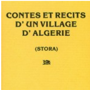
Contes et récits d'un village d'Algérie (Stora) - par Bernard Sasso