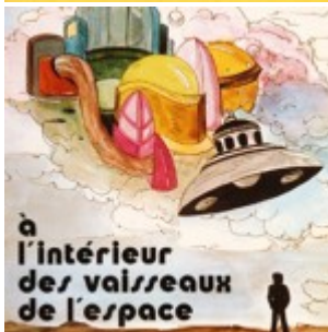
À l'intérieur des vaisseaux de l'espace - par George Adamski