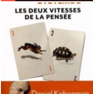
Daniel Kahneman – Système 1, système 2 : les deux vitesses de la pensée