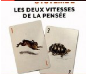
Daniel Kahneman – Système 1, système 2 : les deux vitesses de la pensée