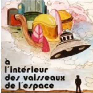
À l'intérieur des vaisseaux de l'espace – par George Adamski