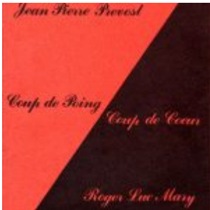
Coup de poing / Coup de cœur