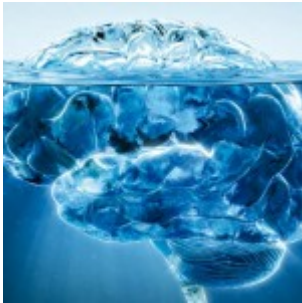
La puissance de l'inconscient : sommes-nous maître à bord?