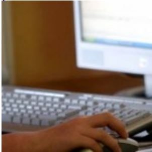
Comment Internet modifie le cerveau