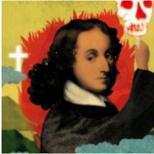
Le moi est haïssable – Blaise Pascal