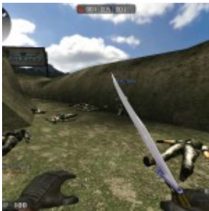
La guerre est la projection spectaculaire et sanglante de notre vie quotidienne