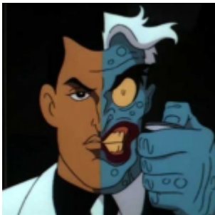
Les visages à deux faces