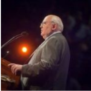
Indignés « Unis pour un changement mondial » : un Nouvel Ordre Mondial ce sera, dit Mikhaïl Gorbachev