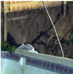
Une doline (sinkhole) en Floride force l'évacuation des résidents