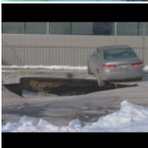
États-Unis : un sinkhole au Utah