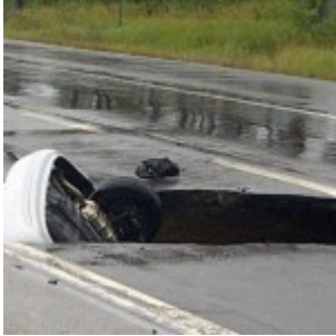
Canada : un « sinkhole » avale une voiture