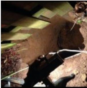
États-Unis : une doline avale une femme et son chien