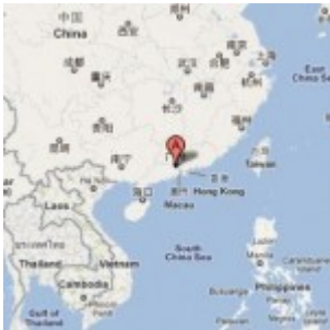
De nouveaux trous terrestres en Chine