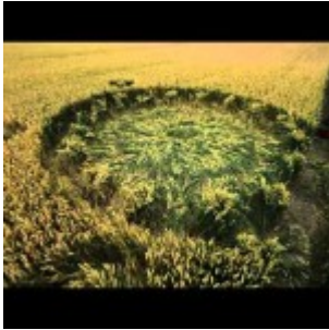
Nouvel agroglyphe dans le Wiltshire